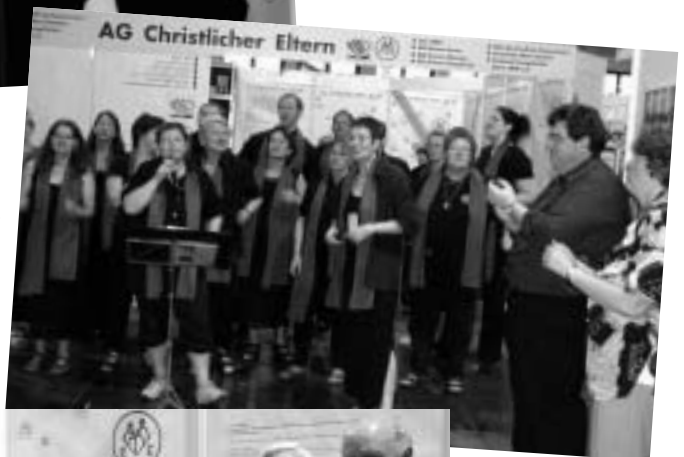
Lebenssprühende Begeisterung am Stand der „ArbeitsGemeinschaft Christlicher Eltern“: die Antonius-Singers aus Bottrop (Bistum Essen).