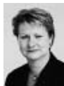
Sylvia Löhrmann (GRÜNE)

Mehr Zeit für Bildung und damit einhergehend mehr Zeit für die Förderung benachteiligter Schülerinnen und Schüler, aber auch solcher mit besonderen Begabung – diesen Beitrag zur Stärkung der Schülerleistung und gleichzeitig zu mehr Chancengleichheit muss die Ganztagschule leisten. Sie muss die Öffnung der einzelnen Schulen in ihrem Stadtteil verstärken. Wir setzen auf die offene Ganztagschule, die neben Lehrerinnen und Lehrern Personen unterschiedlicher Professionen einbindet. Pädagogisch wertvoll ist nicht nur Unterricht. Die Schulen müssen sich auch zu Häusern des Lebens entwickeln, in denen neben dem Einsatz von ErzieherInnen und SchulpsychologInnen auch musische Erziehung, Sport, Kurse im Bereich Handwerken und vieles mehr ihren Platz haben. Die Ganztagschule muss Verlässlichkeit bieten. Denn neben dem Bildungsaspekt ist der offene Ganztags ein wesentlicher Fortschritt zur besseren Vereinbarkeit von Familie und Beruf. Daher sind bedarfsgerechte Öffnungszeiten unverzichtbar. Die offene Ganztagschule bietet die Chancen, durch Rhythmisierung des Unterrichts und eine Umstrukturierung des Tagesablaufs einen wichtigen Beitrag zur Verbesserung der Unterrichtsqualität zu leisten. Offene Ganztagschulen sind damit ein wichtiger erster Schritt als Antwort auf die Herausforderungen, die PISA unserem Bildungssystem stellt.