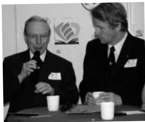
Der Erzbischof und der Kultusminister hatten sich etwas zu sagen und waren einander aufmerksame Zuhörer.