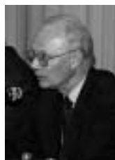
Prof. Dr. Hans Joachim Meyer, Präsident des Zentralkomitees der deutschen Katholiken

Kirchen sind gewiss keine Truppen im gleichen Schritt und Tritt, sondern Gemeinschaften aus Christen, die ihren Glauben verantwortlich und gewissenhaft leben wollen und darüber auch im Dialog stehen. Aber die Kirchen bleiben gleichwohl die Gemeinschaften, aus denen sich die Ökumene aufbaut. Es gibt keinen erfolgreichen Weg der Ökumene ohne oder gegen die verfassten Kirchen. Zwar ist der Geist Gottes immer größer als die geschichtlich gewordene Gestalt der Kirchen. Und wer die ständige Erneuerungsbedürftigkeit der Kirchen leugnet, wird dem Auftrag der Frohen Botschaft nicht gerecht. Die Kirche ist eben nicht, auch wenn dieses Bild immer wieder beschworen wird, ein Fels der Unveränderlichkeit, sondern das Volk Gottes auf der Pilgerschaft durch die Geschichte. Dieser Weg kann nicht ohne Konflikte