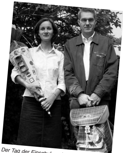
Der Tag der Einschulung ist gekommen ...

Mit Beginn der Schulzeit sollte Ihr Kind einen ungestörten Arbeitsplatz haben; das muss kein eigenes Zimmer sein. Er sollte dem Kind ermöglichen, seine Hausaufgaben regelmäßig, zu einer bestimmten Zeit und ohne Ablenkung zu erledigen. Tisch und Stuhl sollen der Größe des Kindes entsprechen. Tages- oder Lampenlicht soll für Rechtshänder von links, für Linkshänder von rechts einfallen. Für manche Kinder ist es wichtig, bei den Hausaufgaben in der Nähe der Eltern zu sein. Möglicherweise gibt ihnen das die benötigte Sicherheit. Lassen Sie es dennoch selbstständig arbeiten.