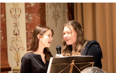
Musikensemble des Egbert-Gymnasiums Münsterschwarzach