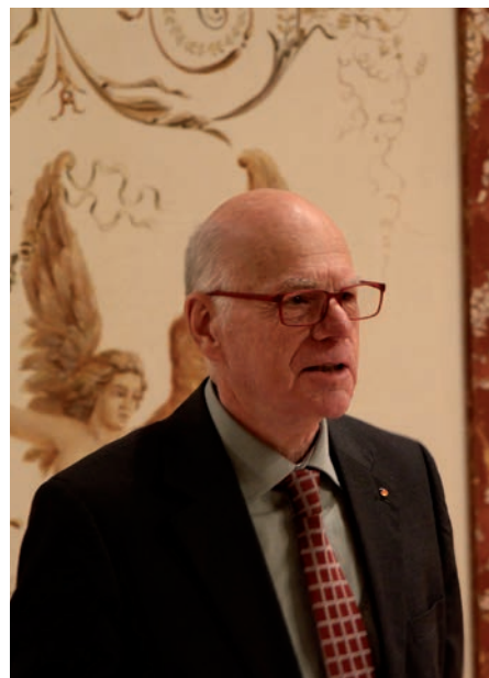
Prof. Dr. Norbert Lammert

Nicht nur die Referenten, die anschließend ihre Vorträge hielten, hatten sich mit dem Thema „Hoffnung“ auseinandergesetzt, sondern auch Schüler/innen des Egbert-Gymnasiums Münsterschwarzach, der Mädchenrealschule Volkach, der Maria-Ward-Realschule und der Don Bosco