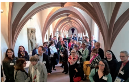
Begrüßung im Kreuzgang

Unser diesjähriger Jubiläumskongress fand in Würzburg statt, in der Stadt, in der unsere KED 1954 gegründet wurde. Das Leitthema war gut gewählt. Statt über die Zustände in Gesellschaft und Politik zu klagen, gar Resignation aufkommen zu lassen, ist jeder von uns gefragt und aufgefordert, sich zu engagieren. Und so hieß es in der Einladung: „... Ist jetzt nicht wieder die Zeit gekommen, wo jeder sich einbringen muss, damit es besser wird? Unsere Eltern und Großeltern haben es uns vorgemacht! Dafür brauchen wir aber Mut und eine innere Kraft, die uns antreibt und stärkt. Wir brauchen Hoffnung! ...“