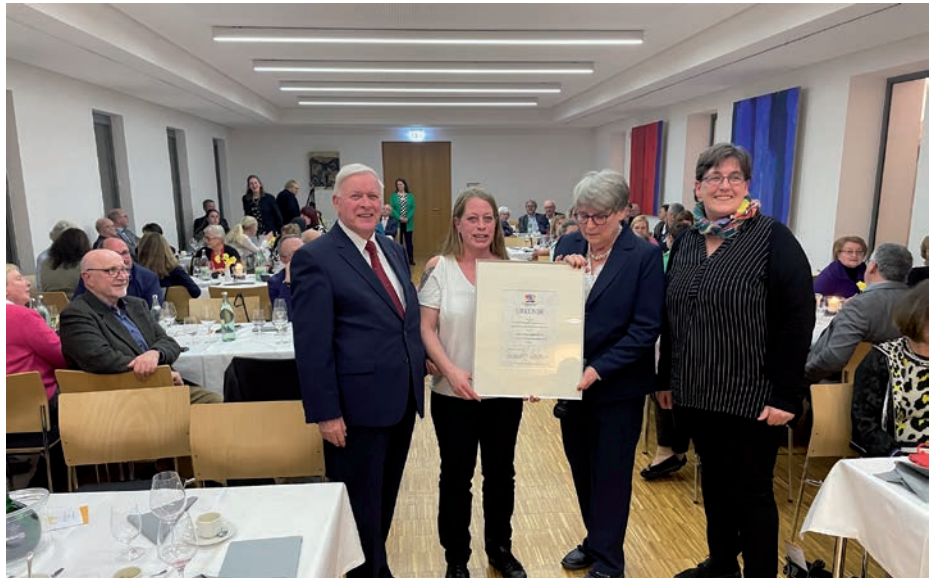
Preisverleihung Pro Cura Parentum